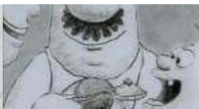
Une bonne journée