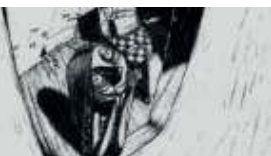
Histoire tragique avec fin heureuse

Dans un pays où les habitants se nourrissent, au sens propre, de lettres et de mots cueillis dans les arbres, la lecture est vitale s'ils ne veulent pas mourir... d'ennui.