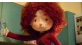
Lola et le piano à bruits