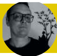
ANTOINE GUILLOPPÉ Auteur/Illustrateur

Il publie des albums depuis 1998 : Loup noir , la série des Akiko et récemment Pleine nuit ou Plein rêve . Ces albums font de son travail un savoureux mélange de peur et de douceur, d'ombre et de lumière.