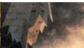
Le Bûcheron des mots

> En présence du réalisateur Augusto Zanovello